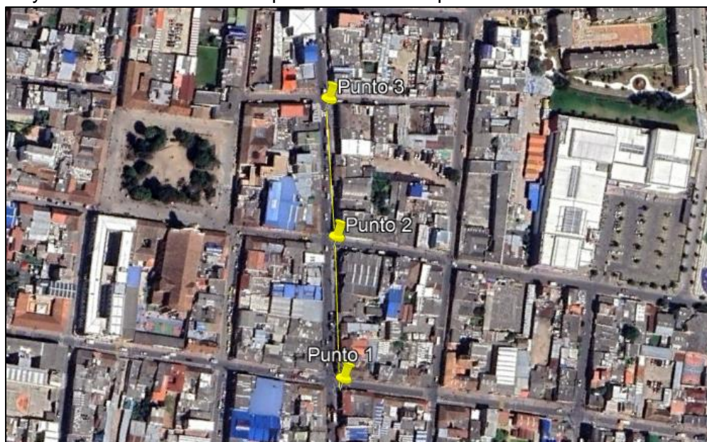
Ilustración 1. Recorrido

Se realizó recorrido de control y vigilancia en el cuadrante 4, barrio CENTRO el día 05 de junio del 2024, desde las coordenadas 4^{\circ}42'56.239''\text{N} - 74^{\circ}12'37.954''\text{W} hasta las coordenadas 4^{\circ}43'1.725''\text{N} - 74^{\circ}12'41.416''\text{W} (ver ilustración 1. Ruta amarilla), con el fin de verificar las condiciones ambientales, identificar posibles afectaciones a los recursos naturales y realizar las acciones de prevención correspondientes.