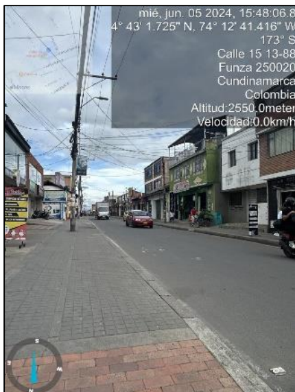
Ilustración 2. Evidencias recorrido